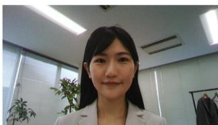
Typical laptop built-in webcam

Zintegrowana kamera internetowa o rozdzielczości 5 megapikseli oferuje ponad dwukrotnie większą rozdzielczość niż Full HD, aby przechwytywać obraz w wysokiej rozdzielczości i naturalnych kolorach zapewniając żywe wrażenia podczas spotkań internetowych. Monitor obsługuje funkcję Windows Hello, która umożliwia szybkie odblokowanie komputera za pomocą funkcji rozpoznawania twarzy, usprawniając dostęp bez hasła przy jednoczesnym zachowaniu bezpieczeństwa.